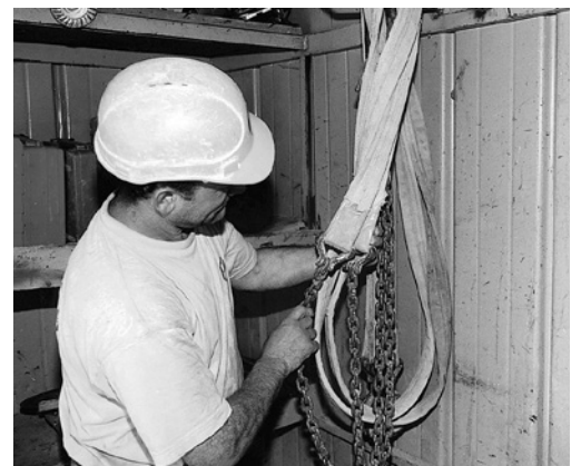
6 Kontrolle der Anschlagmittel.