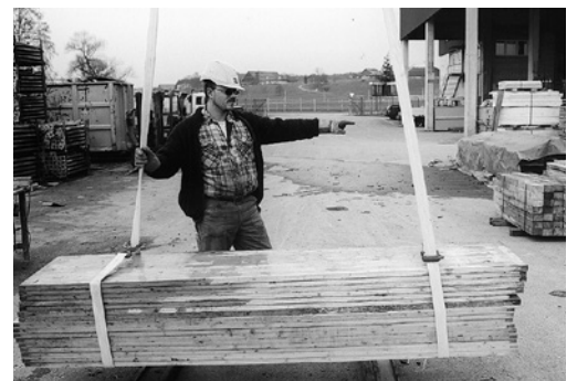
5 Handzeichen schaffen Klarheit.