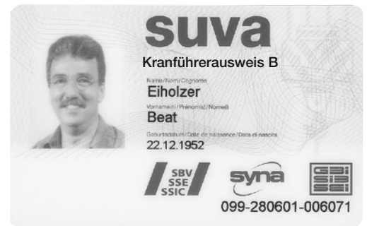
4 Kranführerausweis. Kategorie A: Fahrzeugkrane Kategorie B: Turmdrehkrane